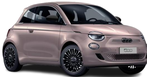
237 (5CF) - Kovinska barva (zlata - Rose Gold)