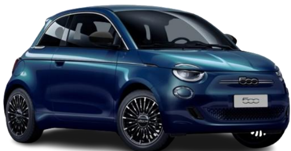
230 (5CE) - Kovinska barva (zelena - Ocean Green)