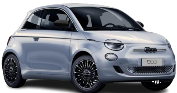
252 (5CD) - Kovinska barva (modra Celestial)