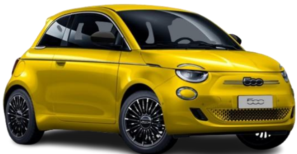
554 (CZ8) - Kovinska barva (rumena – Sun of Italy)