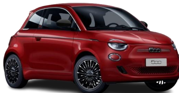
111 (5CJ) - Pastelna barva (rdeča - RED)