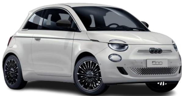
268 (4H5) - Pastelna barva (bela - Ice White)