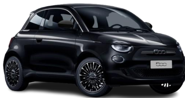
601 (10N) - Pastelna barva (črna - Onyx Black)