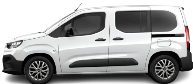
Qubo L - ICON