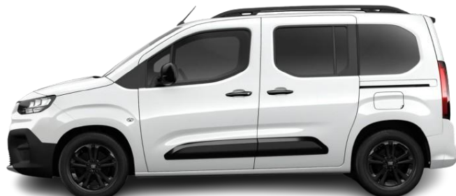
Qubo L - LA PRIMA