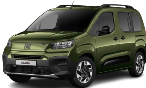
550 - Zelena Toscana (kovinska)