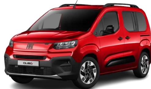
182 - Rdeča Passione (kovinska)