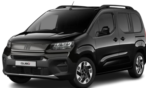
632 - Črna Cinema (kovinska)