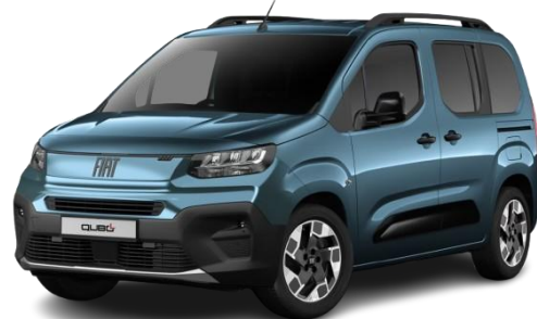
528 - Modra Volare (kovinska)