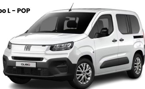
Qubo L - POP