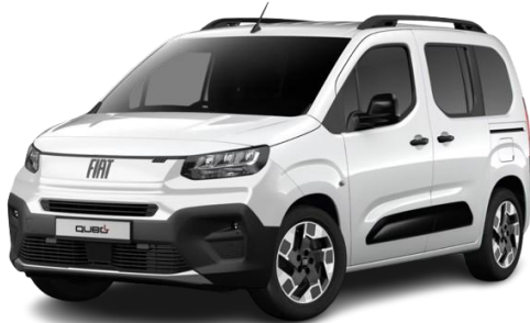
549 - Bela Gelato (pastelna)