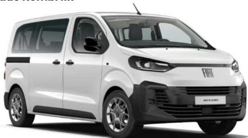
Scudo Kombi M1