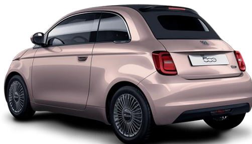
Zlata - Rose Gold (kovinska barva) barva: 237, opcija: 5CF